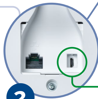
Buchse für Stecker

Die Form des Steckers ermöglicht das Einstecken nur, wenn der Stecker richtig gedreht ist!