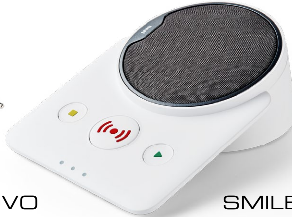
NOVO Das Hausnotrufgerät