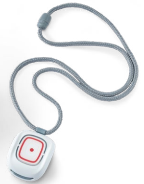
SMILE Der tragbare Funksender